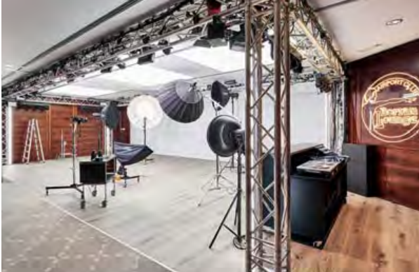
FOTO- & VIDEO-STUDIO