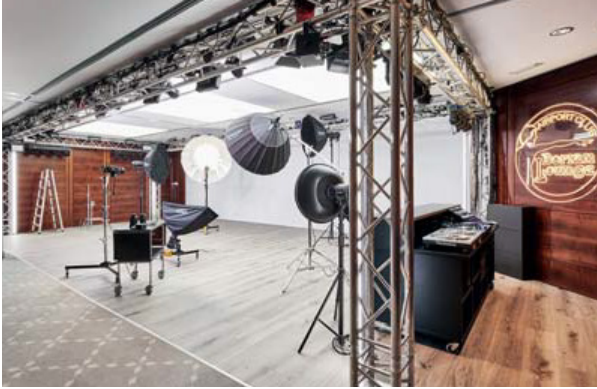
FOTO- & VIDEO-STUDIO